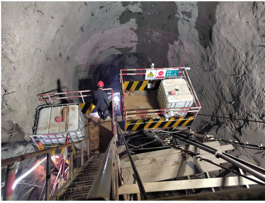
(a) 运输小车人员上下图