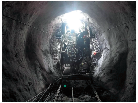
(b) 扩挖台车掌子面图